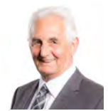
David J Rowlands AC UKIP Cymru Dwyrain De Cymru