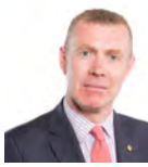
Adam Price AC Plaid Cymru Dwyrain Caerfyrddin a Dinefwr