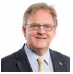
Mark Isherwood AC Ceidwadwyr Cymreig Gogledd Cymru