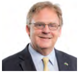
Mark Isherwood AC Ceidwadwyr Cymreig Gogledd Cymru