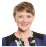
Bethan Sayed AC Plaid Cymru Gorllewin De Cymru