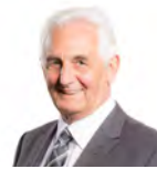
David J Rowlands AC UKIP Cymru Dwyrain De Cymru