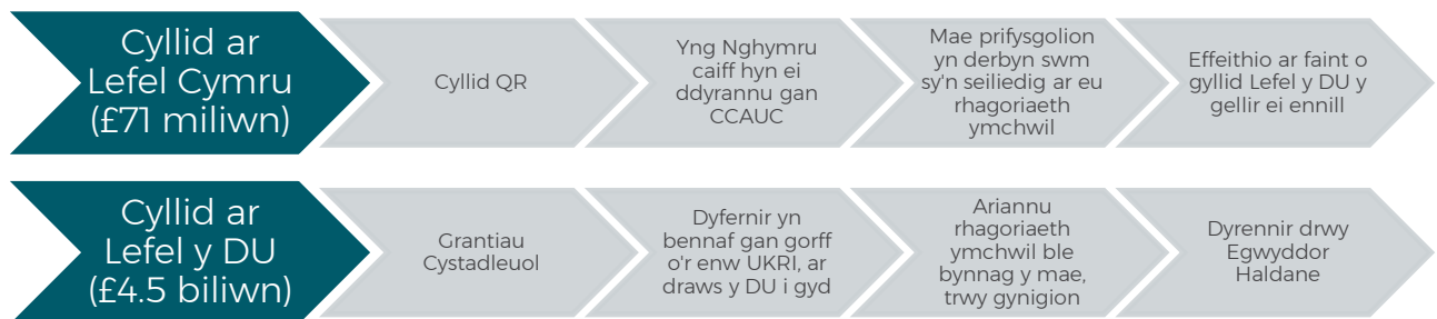
Ffigur 1: Ffynonellau ariannu ar gyfer Prifysgolion Cymru 2018/19

42. Conglfaen arall o gyllid ymchwil ac arloesedd yn y DU yw Egwyddor Haldane. Yn fras, dywed yr egwyddor y dylai penderfyniadau am gynigion ymchwil gael eu gwneud drwy adolygiad gan gymheiriaid ac nid gan y llywodraeth.