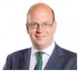
Mark Reckless AC Grŵp Ceidwadwyr Cymreig Dwyrain De Cymru