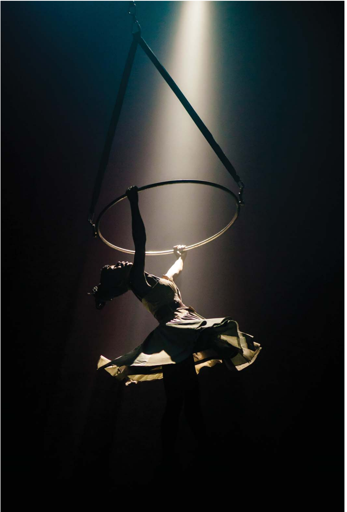
BIANCO , NoFit State (Ilun: Richard Davenport)