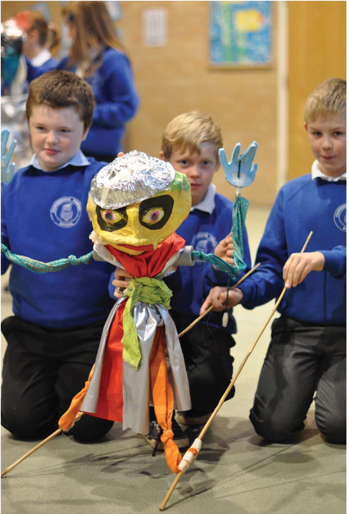
Chwarae'r Chwedl, Prosiect Ysgolion Cynradd ym Mhowys