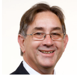
Mick Antoniw (Cadeirydd) Llafur Cymru Pontypridd