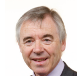
Ieuan Wyn Jones Plaid Cymru Ynys Môn