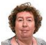
Helen Mary Jones AS Plaid Cymru