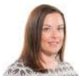
Vikki Howells AS Llafur Cymru