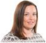
Vikki Howells AS Llafur Cymru