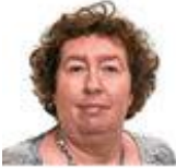
Helen Mary Jones AS Plaid Cymru