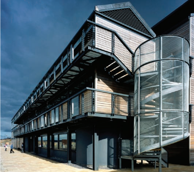
Galeri Caernarfon

1.13 Y cyrff sy'n ymgeisio am grantiau i Gyngor y Celfyddydau sy'n penderfynu pa ddull caffael i'w fabwysiadu ar gyfer eu prosiectau adeiladu mawr. Heblaw am rai eithriadau cymharol brin (sy'n cynnwys y contract dylunio ac adeiladu ar gyfer Canolfan Mileniwm Cymru), mae'r rhan fwyaf o ymgeiswyr am grant yn dilyn llwybr traddodiadol wrth gaffael, gyda chontractau ar wahân ar gyfer yr elfennau dylunio ac adeiladu. Mae Cyngor y Celfyddydau yn ffafrio'r dull gweithredu hwn gan ei gleientiaid, ar y cyfan, fel yr un sy'n fwyaf priodol ar gyfer y rhan fwyaf o brosiectau cyfalaf mawr (sy'n rhai ar gyfer adnewyddu a gwella yn hytrach na rhai ar gyfer adeiladu o'r newydd) ac fel un sy'n lleihau'r perygl o amharu ar ansawdd adeiladau oherwydd pwysau o ran costau ac amser yn ystod y cyfnod adeiladu.