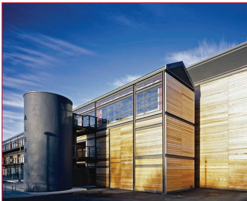
Galeri Caernarfon