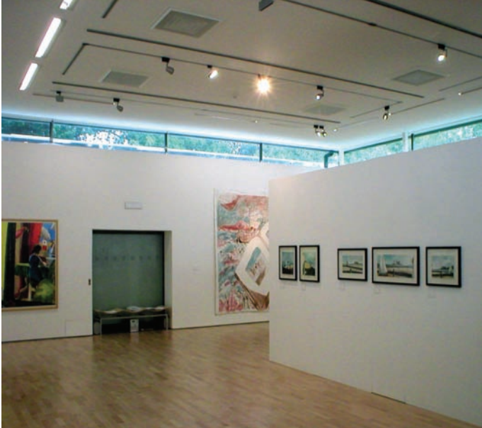
Oriel Davies

canolfan ragoriaeth ym maes celfyddyd gymwysedig, mae Cyngor y Celfyddydau yn bwriadu cynyddu ei gyllid refeniw craidd i Ganolfan Grefftai Rhuthun cyn cwblhau'r prosiect cyfalaf, yn ogystal â chyfrannu £3.1 miliwn ar ffurf grant cyfalaf tuag at gost ailadeiladu'r ganolfan.