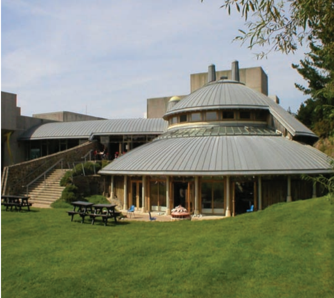
Canolfan Gelfyddydau Aberystwyth

gyfer cydweithio, yn enwedig i gryfhau'r ddadl dros fuddsoddi mewn diwylliant a'r celfyddydau fel modd i ysgogi newid economaidd a chymdeithasol. Mae gan Gyngor y Celfyddydau gynrychiolwyr hefyd o bob un o'r 22 o awdurdodau lleol yng Nghymru ar ei dri Phwyllgor Rhanbarthol i'w helpu i gynllunio a llunio ei strategaethau celfyddydau rhanbarthol ei hun. Er hynny, mae cryn amrywiad yn y cysylltiadau sydd rhwng Cyngor y Celfyddydau ac awdurdodau lleol unigol yng Nghymru ynghylch buddsoddiadau cyfalaf yn y celfyddydau. Mae gwahaniaethau hefyd rhwng lefelau'r buddsoddi gan awdurdodau lleol mewn cyfleusterau a rhaglenni celfyddydol, yn wyneb y cystadlu rhwng gwahanol flaenoriaethau am adnoddau ariannol 11 a'r ffaith bod buddsoddi mewn darpariaeth i'r celfyddydau'n fater i ddisgresiwn awdurdodau lleol.