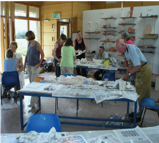
Gweithgaredd yng Nghanolfan Gelfyddydau Aberystwyth

2.1 Er mwyn cydymffurfio â gofynion ariannol ei brif noddwr, Llywodraeth y Cynulliad, a'r rhai gan yr Adran dros Ddiwylliant, y Cyfryngau a Chwaraeon, mae angen i Gyngor y Celfyddydau sicrhau ei fod yn rheoli gwariant dan ei raglen gyfalaf gan ddal sylw ar egwyddorion priodoldeb a gwerth am arian. Risgiau allweddol i Gyngor y Celfyddydau yw y gallai fethu â rheoli'r graddau y mae'n agored i risgiau ariannol yn ddigonol yn ystod cyfnodau datblygu ac adeiladu prosiectau cyfalaf mawr ac, ar ôl cwblhau prosiectau, y gallai'r cyfleusterau newydd neu gyfleusterau wedi'u gwella ddod ag enillion gwael ar fuddsoddiad cyfalaf Cyngor y Celfyddydau, o ran cael lefelau digonol o weithgarwch celfyddydol i fod yn hyfyw.