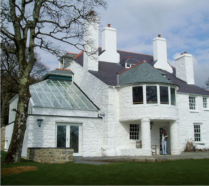
Canolfan Ysgrifennu Tŷ Newydd

gallu neu hybu sefydlogrwydd ariannol, a oedd yn ychwanegol at grantiau refeniw blynyddol penodol Cyngor y Celfyddydau. Gall Cyngor y Celfyddydau ystyried yr angen am gyllid refeniw ychwanegol i wella sefydlogrwydd ariannol cyn i gorff celfyddydol gyflwyno cais ffurfiol am grant cyfalaf, fel a ddigwyddodd yn achos Canolfan Grefftau Rhuthun ( Astudiaeth Achos M ) ac Oriol Mostyn ( Astudiaeth Achos N ). Mae'r rhaglen beilot yn dal i redeg, ac roedd yr adolygiad o'r rhaglen a oedd wedi'i drefnu'n wreiddiol ar gyfer 2006-2007 wedi'i ohirio wrth ddisgwyl canlyniad yr Adolygiad o'r Celfyddydau yng Nghymru yn 2006 ac, ar ôl hynny, wrth ddisgwyl yr ad-drefnu mewnol gan Gyngor y Celfyddydau ei hun, sydd i'w gwblhau erbyn Hydref 2007. Mae'r rhaglen beilot ar gyfer celfyddydau cynaliadwy'n dangos y gydberthynas rhwng ffrydiau ariannu cyfalaf a refeniw Cyngor y Celfyddydau a'i ymdrechion