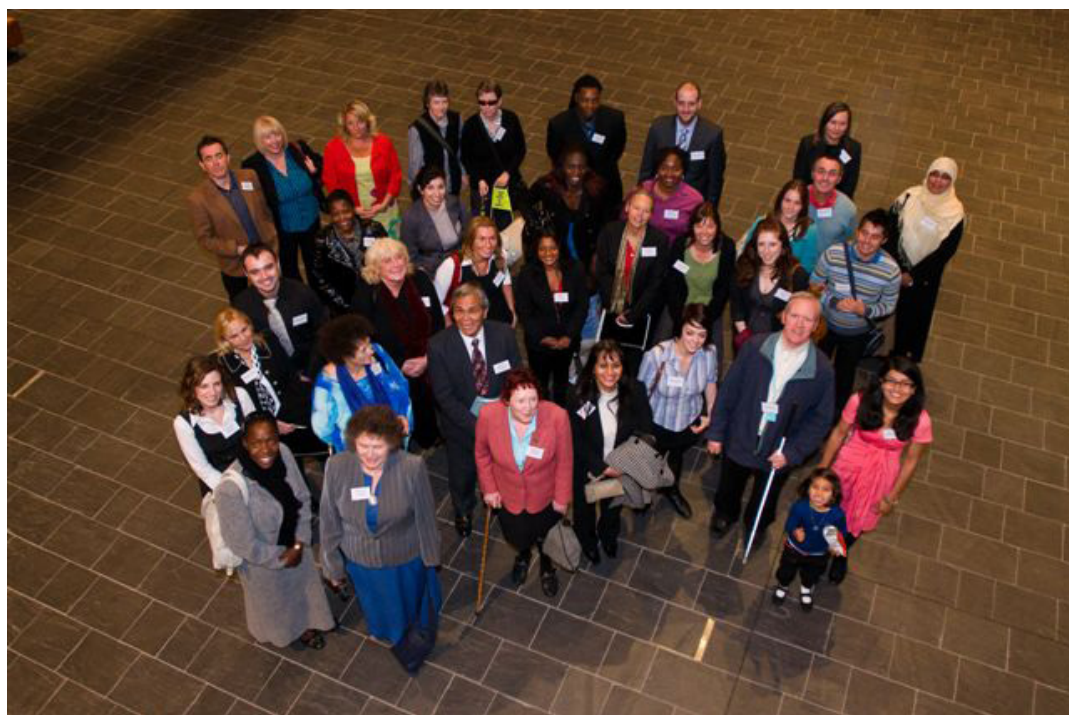
Cyfranwyr y Cynllun Mentora Camu Ymlaen Cymru