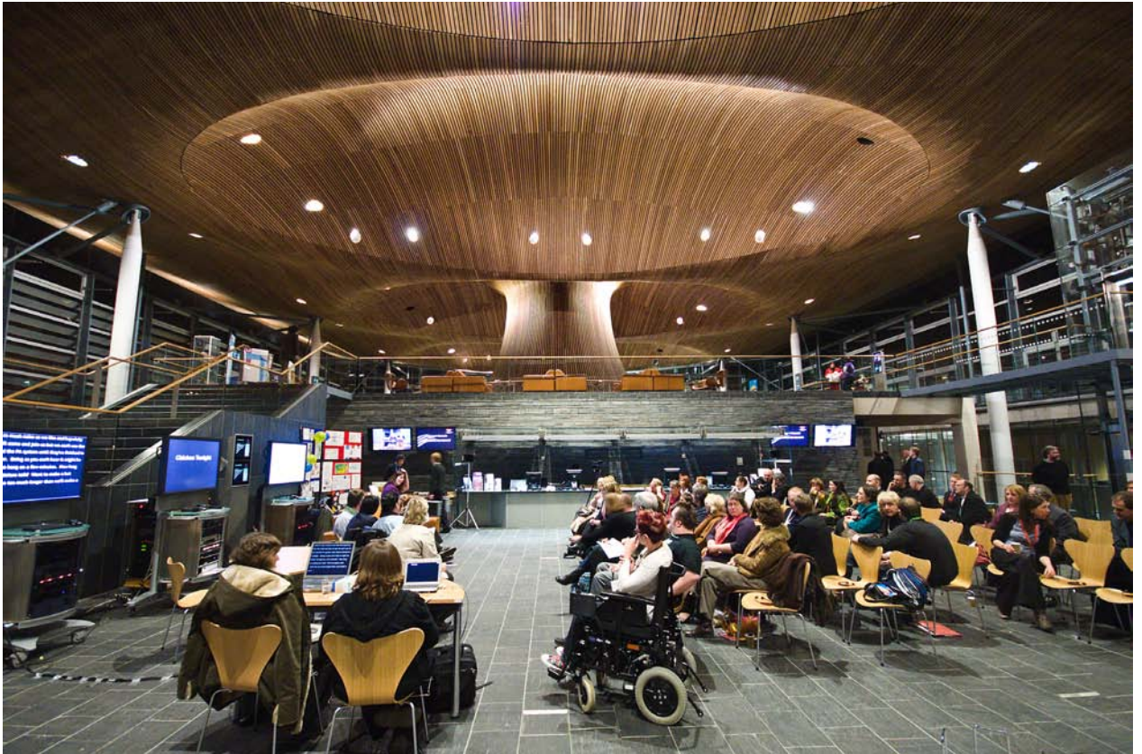
Digwyddiad Diwrnod Rhyngwladol Pobl Anabl 2008 yn y Senedd

“Darparwyd gwasanaethau cymorth gwych ar gyfer Diwrnod Rhyngwladol Pobl Anabl. Roedd cymorth ardderchog ar gael drwy’r dydd a gwnaethoch sicrhau bod ein holl anghenion yn cael eu diwallu.”