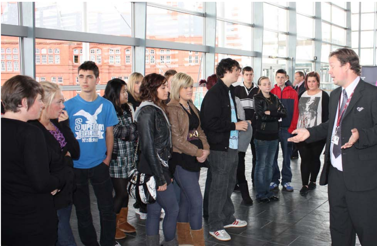
Staff Cynulliad Cenedlaethol Cymru