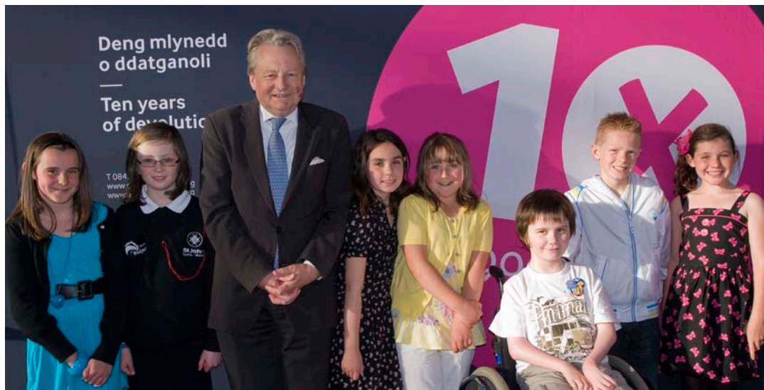
Y Llywydd yn cyfarfod pobl ifanc ar 12 Mai 2009

I ddathlu deng mlynedd ers cynnal Cyfarfod Llawn cyntaf Cynulliad Cenedlaethol Cymru, cynigwyd y cyfle i blant o bob rhan o Gymru a anwyd ar 12 Mai 1999 ddathlu eu pen-blwyddi mewn steil yn y Senedd. Ymunodd plant o Gaerfyrddin, Neyland, Wrecsam, Abertawe, Caerdydd, Casnewydd a Thywyn ag Aelodau'r Cynulliad a chyn Aelodau'r Cynulliad i nodi'r diwrnod arbennig hwn.