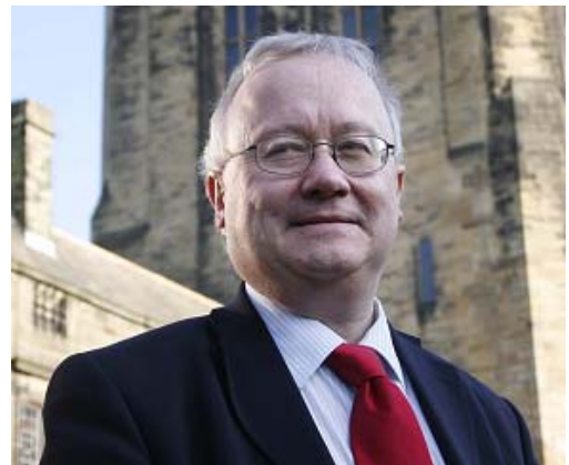
Leighton Andrews AC, Y Dirprwy Weinidog dros Adfywio

Ac yn union fel y mae'r Cynllun Gweithredu yn ffrwyth gwaith amryw o ddwylo, felly hefyd y daw llwyddiant trwy barhau i gydweithredu ar draws y sector cyhoeddus ac alinio buddsoddiadau eraill. Y gallu hwn i integreiddio adnoddau a gwasanaethau er mwyn mynd i'r afael â'n problemau sy'n gwneud y Gymru newydd yn lle cyffrous i fod ynddo heddiw - yn enwedig os ydych yn gweithio ym maes adfywio. Credaf y bydd y ffordd o weithio a ddatblygwyd ymysg ein gilydd ym Môn a Menai, ynghyd â'r Cynllun Gweithredu hwn, yn batrwm o ran llwyddiant lleol ac o ran dangos sut y gall cenedl fechan fynd i'r afael â'r amryw o heriau sy'n ei hwynebu, gan groesawu a gwneud y gorau o newid, a chadw ei hunaniaeth ar yr un pryd. Dyma, yn anad dim, yw ein nod ym Môn a Menai, lle rydym yn creu dyfodol newydd gyda'n gilydd yn y bröydd hyn sy'n fwrwm o hanes a diwylliant - gan fod yn ymwybodol o'n hymrwymiad i'n gorffennol, ond hefyd yn edrych ymlaen at ddechreuadau newydd. Mae'r dyfodol yn dechrau nawr, gyda'r bartneriaeth hon, y Cynllun Gweithredu hwn a'r cymunedau hyn.