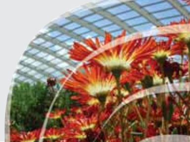
Ffigwr 9: Newidiadau yng Nghynllun Busnes yr Ardd yn tueddu i ragweld cynnydd yn nifer ymwelwyr, mewn incwm ac mewn gwariant